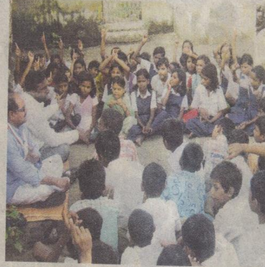
वस्तापूरच्या बालसंसदेत सहभागी बालक.